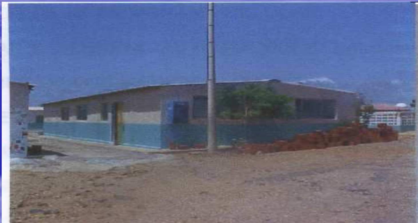
AMBULATORIO RURAL TIPO II LAS CUMARAGUAS ESTADO FALCON