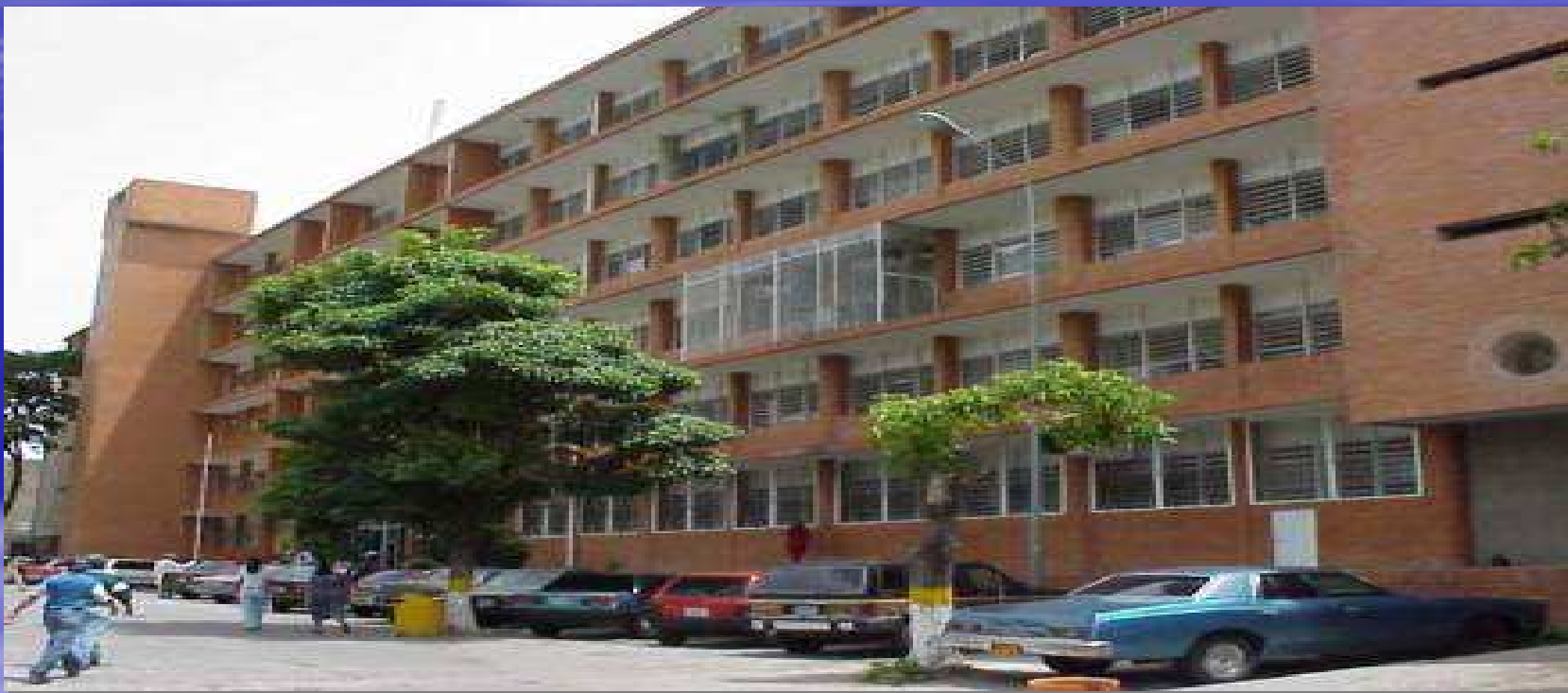
Hospital Antonio María Pineda Barquisimeto Estado Lara