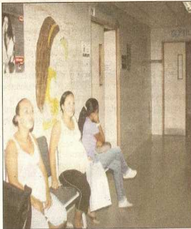
Las embarazadas padecieron nuevos ruleteos.

“Una señora llegó angustiada, porque su niño se cayó y se golpeó varias partes del cuer-