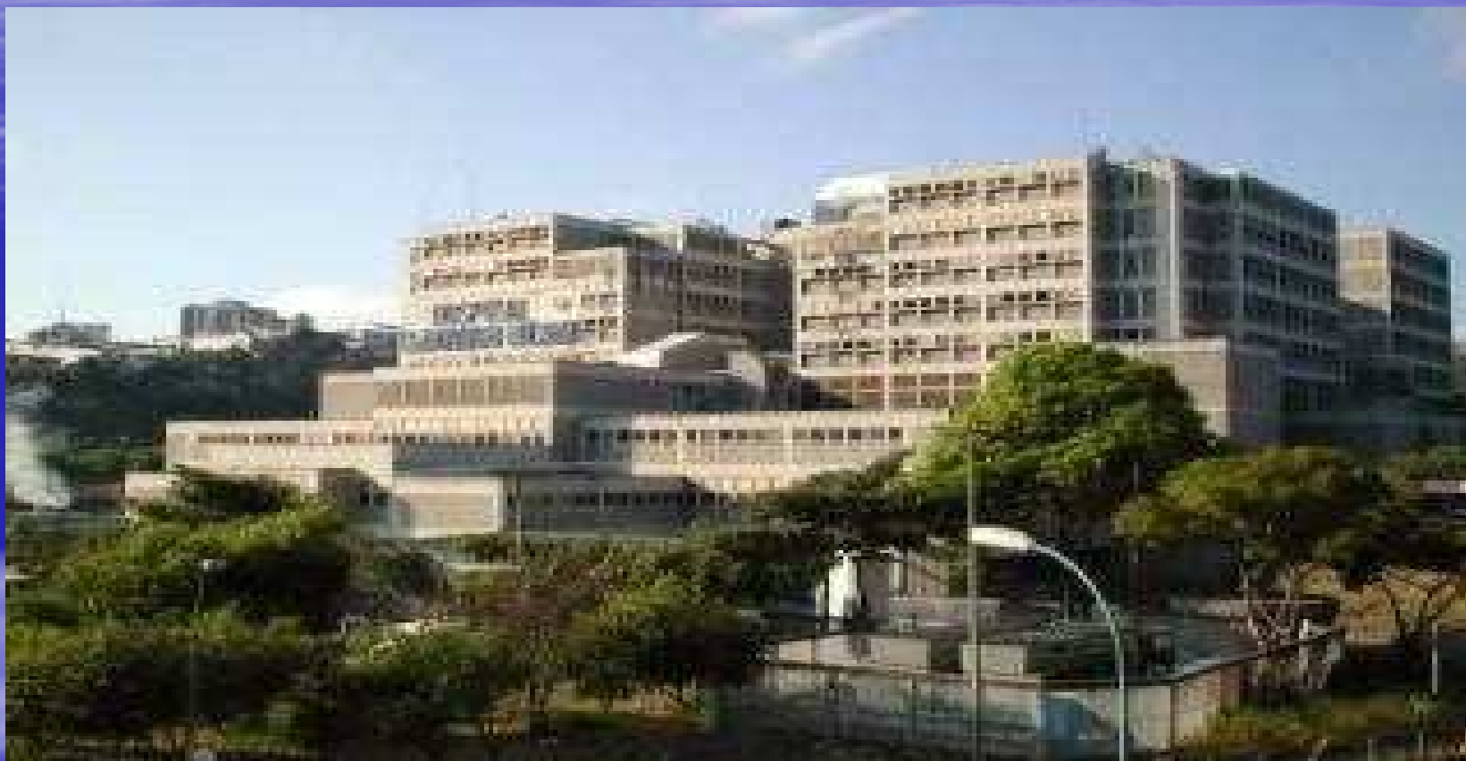
HOSPITAL UNIVERSITARIO DE MARACAIBO