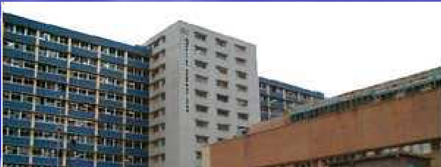
HOSPITAL MIGUEL PEREZ CARREÑO